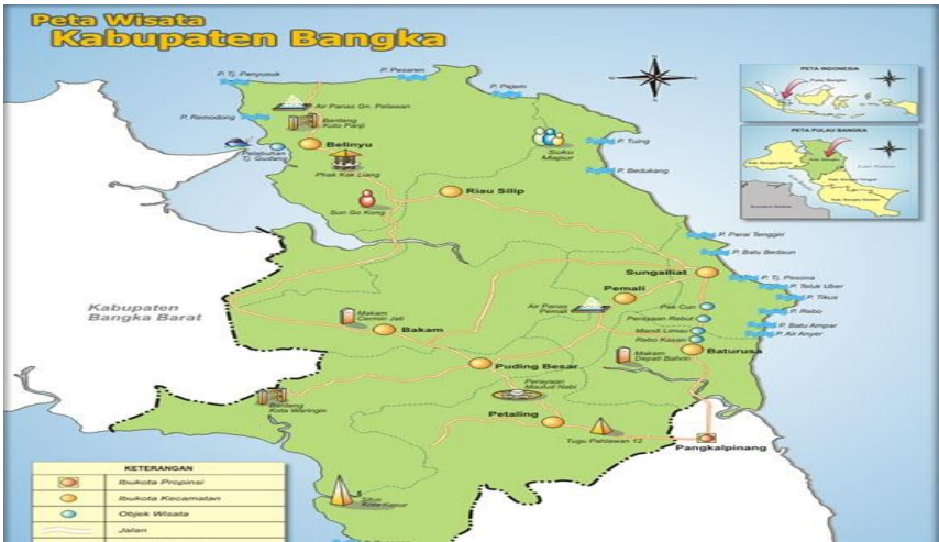
Gambar 1.1 PETA KABUPATEN BANGKA

Jumlah penduduk yang ada di Kecamatan Merawang Per 16 November tahun 2020 sebanyak 29.078 Jiwa dengan rincian sebagai berikut :